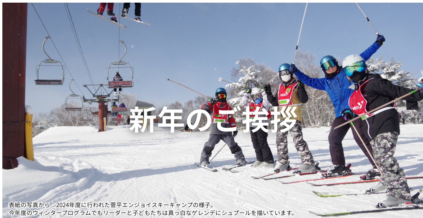
表紙の写真から：2024年度に行われた菅平エンジョイスキーキャンプの様子。 今年度のウィンタープログラムでもリーダーと子どもたちは真っ白なゲレンデにシュプールを描いています。

2026年1月1日発行 公益財団法人とちぎYMCA 〒321-0904 宇都宮市陽東4-18-30 TEL:028-624-2546 FAX:028-624-2489 https://www.tochigiymca.org 発行人/塩澤 達俊 編集人/公益財団法人とちぎYMCA